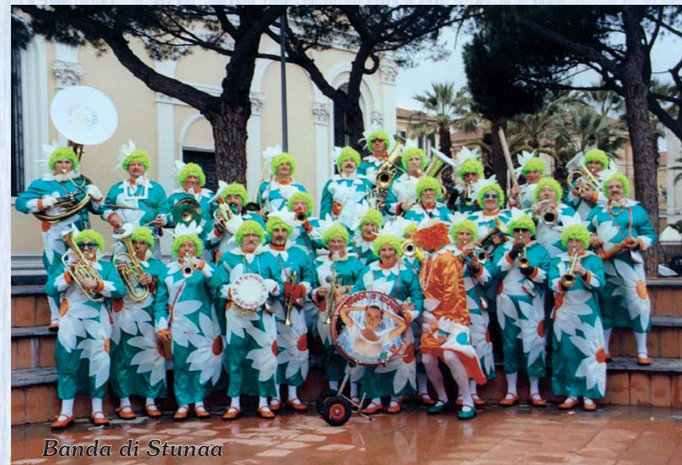
Banda di Stunaa