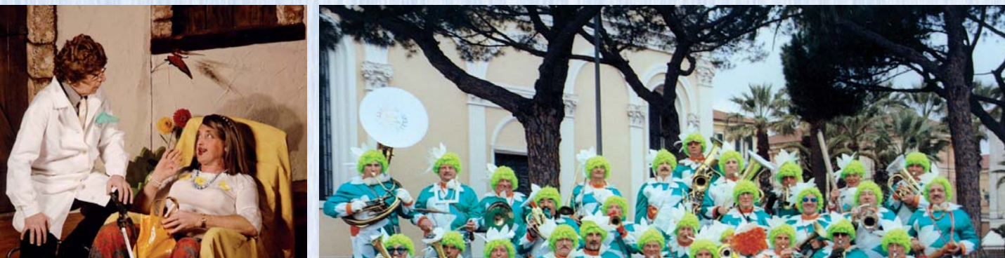
Repertorio di Carnevale