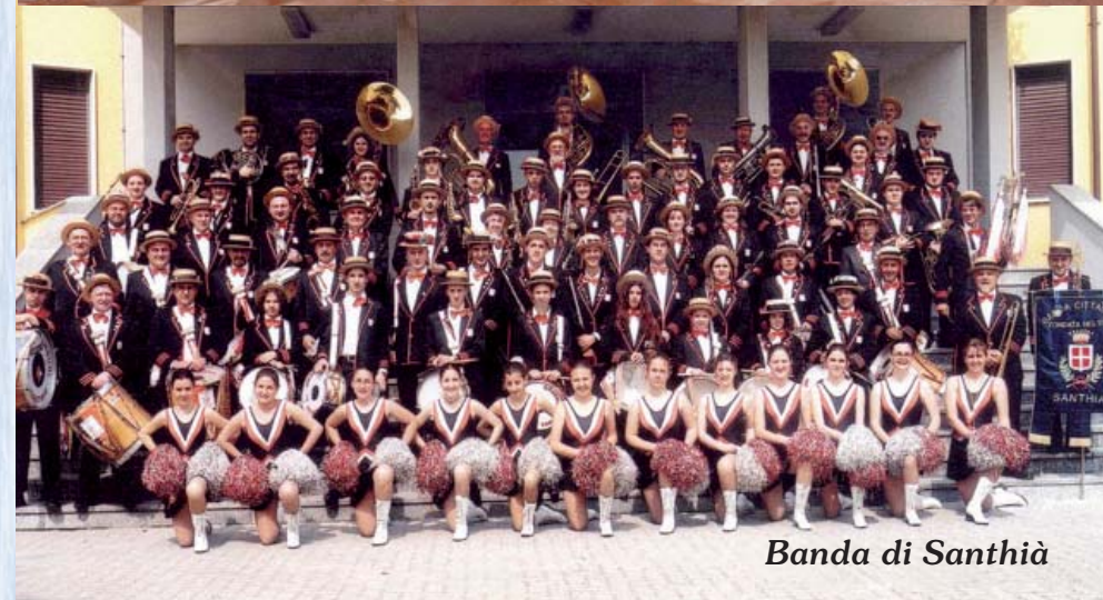
Banda di Santhià