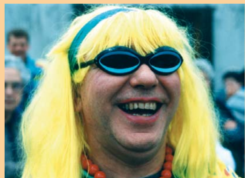
BANDA DI STUNAA