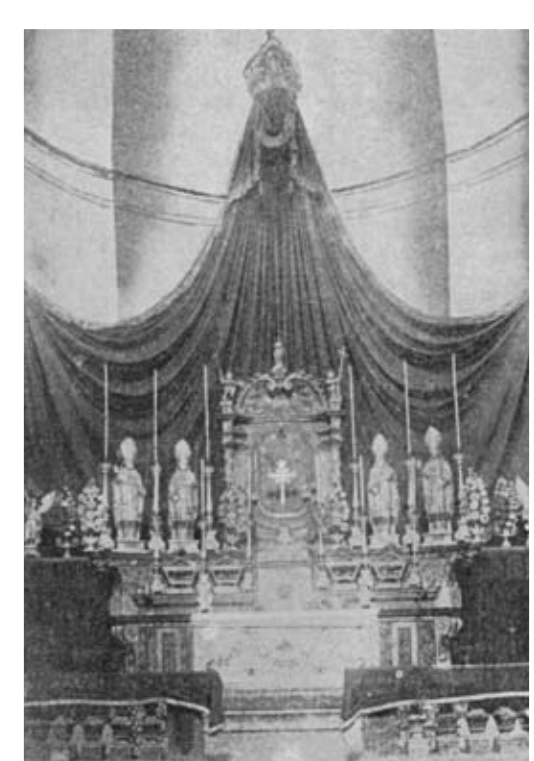
Altare Maggiore - foto del 1923